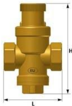
Рис 3. Габаритные размеры